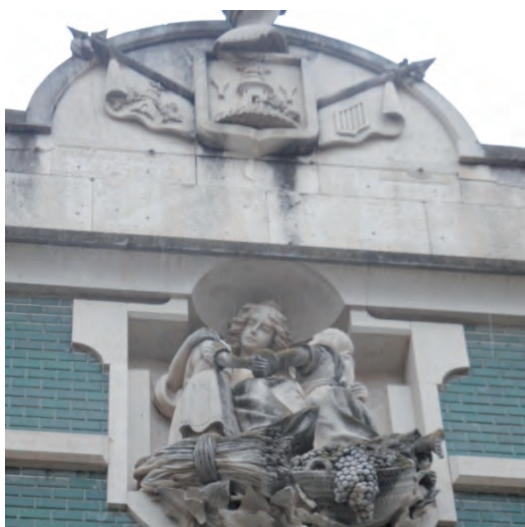
Detalle superior del edificio: a la izquierda el reproducido en 1929 en el Libro del Ahorro; a la derecha, en la actualidad.