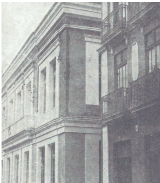
Fachada principal de la sede de la Caja Rural de Ahorros y Préstamos del Sindicato Católico Agrícola de Yecla, reproducida en el Libro del Ahorro en 1929. ¿Es el mismo edificio que el del Casino Primitivo?