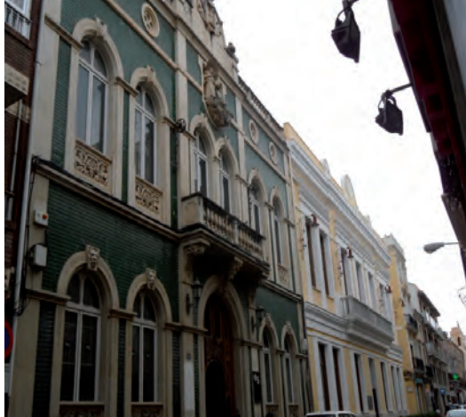
Edificio en la actualidad, sede del SabadellCAM; a su derecha sede del Casino Primitivo y hoy centro cultural .

A la vista de las fotos que se reproducen podría inferirse que ambas entidades estuvieron en la misma calle, pared con pared; dejó a algún colega yeclano que nos aclare si el edificio del Sindicato Católico es el después ocupado por el Casino Primitivo y hoy centro cultural. En cualquier caso, la actual sede del SabadellCAM es un edificio muy interesante, con un siglo de historia a cuestas, que parece haberla olvidado de forma fría y laxa; algo lamentable.