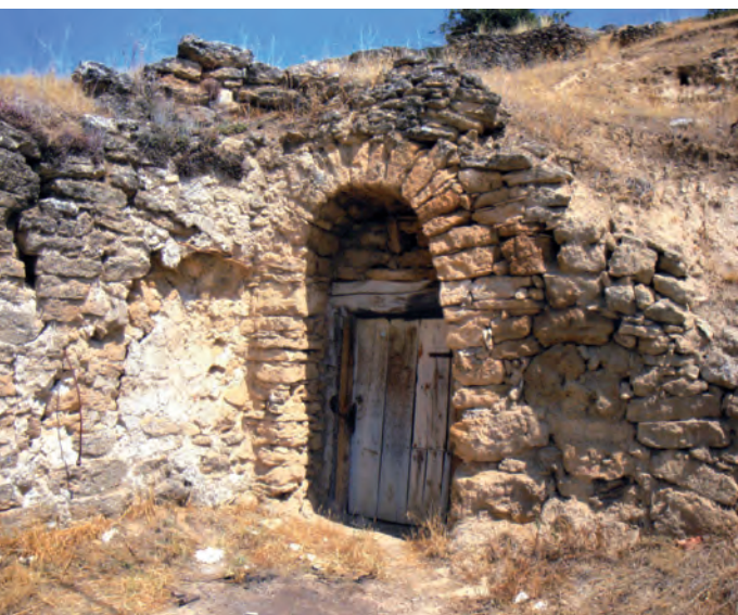
3º Premio: La Cueva de Pepe Autor: F.L.Navarro Albert