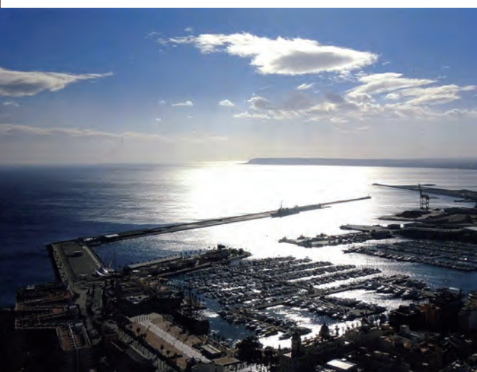
2º Premio: Puerto de Alicante Autor: Pedro Barberá Navarrete