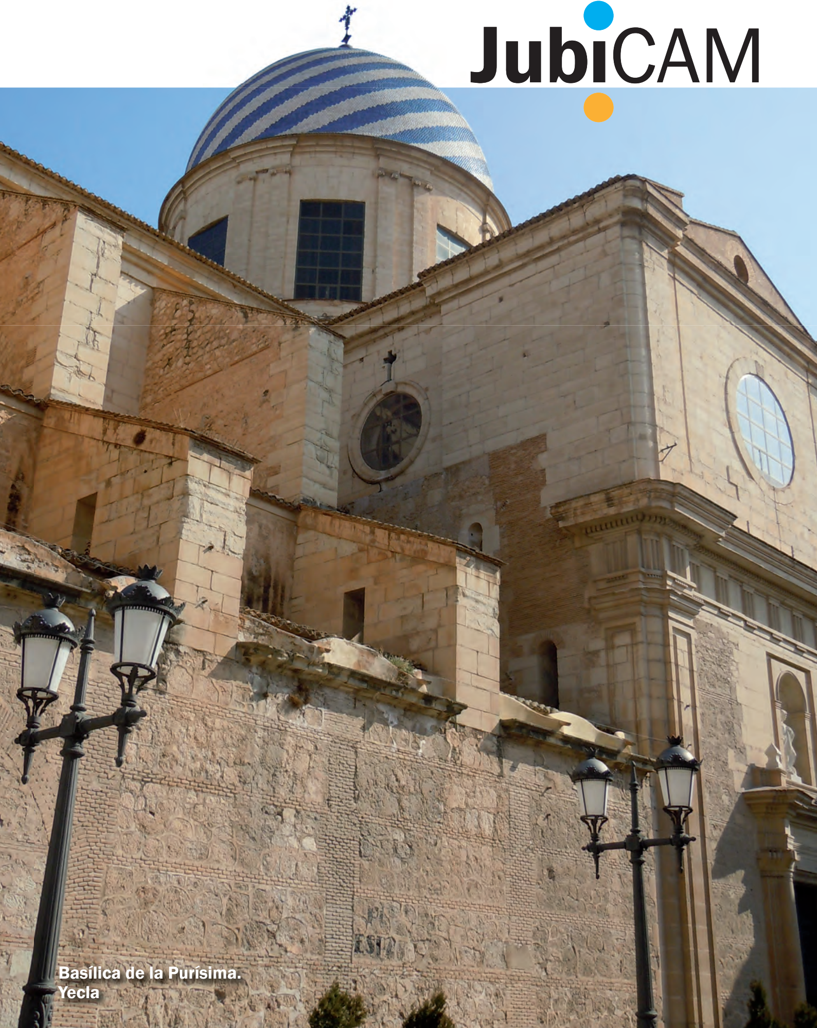
Basilica de la Purísima. Yecla