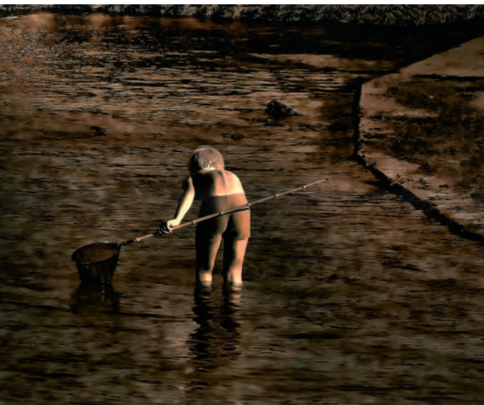
1º Premio: Niño pescando Autor: Julián Sánchez Pérez